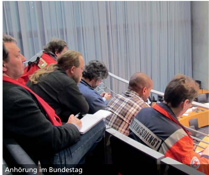
Anhörung im Bundestag