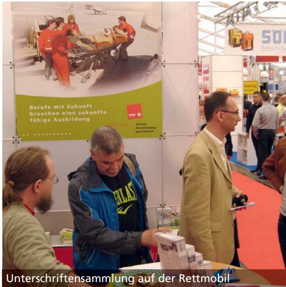
Unterschriftensammlung auf der Rettmobil